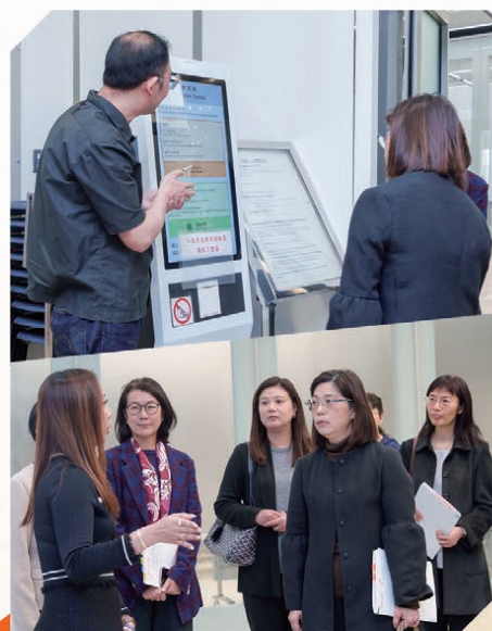
教育局學位分配組的同事分享他們的日常工作。