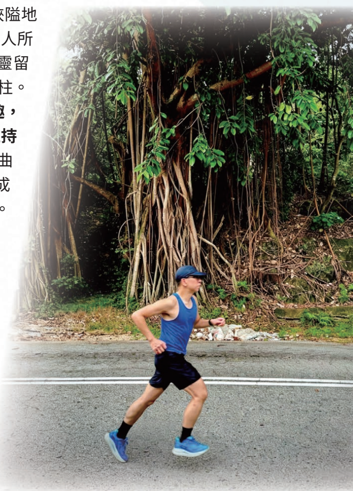
陳處長一直以運動舒緩壓力，鍛鍊身心。

「運動可以鍛鍊體格，更重要是鍛鍊自律克己的意志。長跑時心境平靜，可以專注當下，忘記工作壓力，完成後亦會帶來莫大的滿足感。」陳處長笑言自己在四十多歲才開始接觸這項耐力運動，雖然缺乏天賦亦輸在起跑線，至今亦可完成數次半馬及全馬。特別值得一提的是，除了享受長跑帶來的獨處時光，他每個星期六清晨五時都定期與十多位大學宿友進行十公里長跑及游泳鍛鍊，風雨不改。持續多年的運動習慣，不但有助他保持強健體魄，通過為自己創造的獨處時光及與好友一起互動，亦為他提供了舒緩工作壓力的空間。