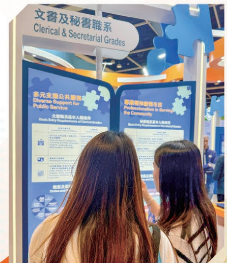
文書及秘書職系的資訊攤位

三位同事對有機會參與是次招聘宣傳活動，都感到難得及興奮。讓我們一起聽聽他們所作的分享。