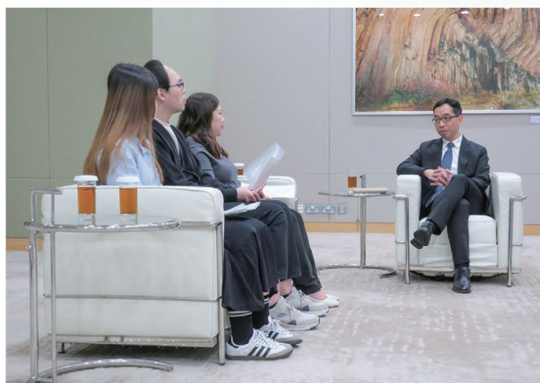
陳處長與文書及秘書職系同事分享工作和生活點滴。

從「以民為本」的選舉工作到「以人為本」的一般職系管理工作，陳處長分享他的管理理念：「作為一般職系處長，我會虛心聆聽各方的意見，帶領我的團隊管理行政主任職系和文書及秘書職系人員。職系管理應當「以人為本」，人與人之間的相處，絕不能用冰冷的數據去理解，人力資源管理工作是科技無法完全替代的，這點未來也不會改變。」