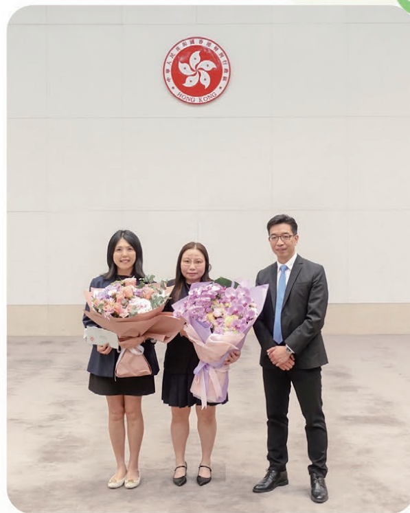
一般職系處長與晉升私人助理及高級私人秘書的同事合照