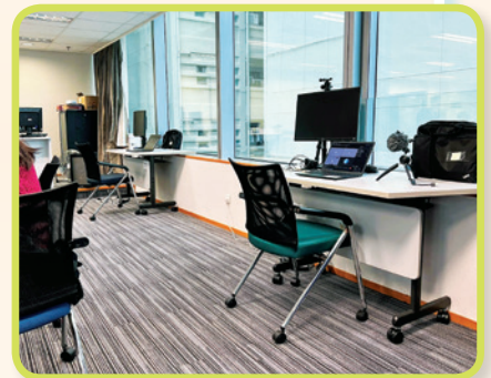
課室設置多台電腦，模擬視像會議的情況，為學員提供實習訓練

課程更提供實際操作訓練，導師會設置多台電腦，模擬視像會議的情況，讓學員實習如何設立與管理視像會議，從而鞏固課程中學到的知識與技巧，並體會視像會議使用者可能遇上的困難，以便學員回到工作崗位後，能學以致用，為工作間提供有效適切的相關行政安排及支援。