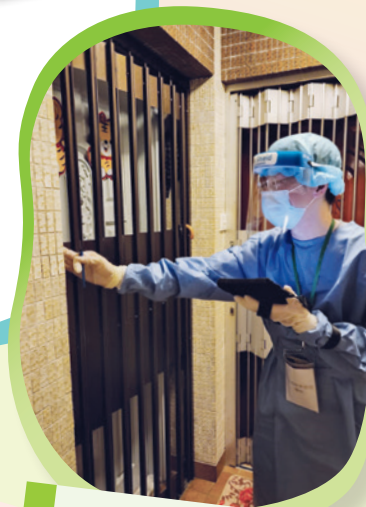
同事上樓拍門為居民登記資料