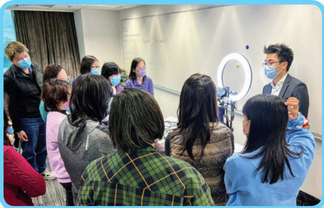
導師講解各類軟硬件的基本運作原理及操作

因應2019冠狀病毒病疫情，各政策局或部門不時需要透過視像形式舉行會議、交流或培訓課程等，以便在維持運作及服務安排的同時，減少同事之間的接觸及辦公室內的人流。