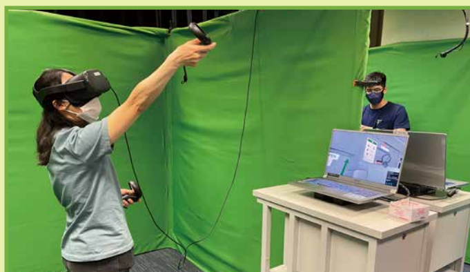
學員利用虛擬實境技術，體驗各行各業的培訓工作