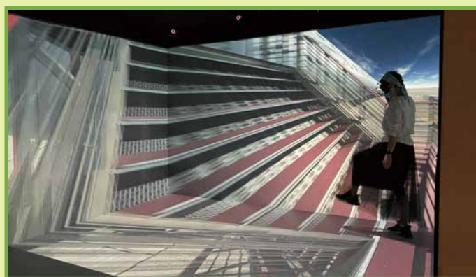
學員戴上3D眼鏡，在虛擬環境中執行真實任務。這活動旨在訓練團隊協作和溝通