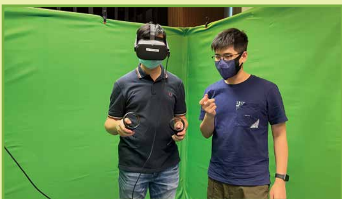
負責虛擬實境實驗室的導師教導學員如何應用技術