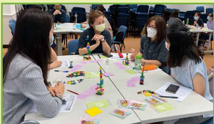
學員在小組中分享自己透過LEGO®模型而表達的意思，藉此加強互動和溝通