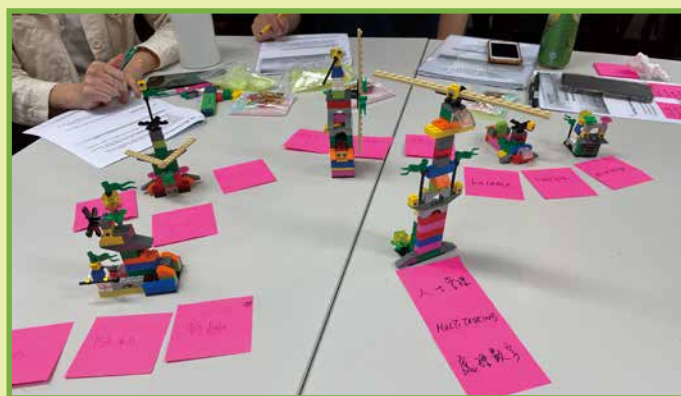
學員用LEGO®模型表達自己在工作上的強項