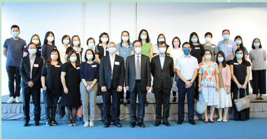
一般職系處的管理層與眾高級文書主任合照

為促進職系管方與同事的溝通及加深了解同事的工作情況，處方繼續邀請不同部門的高級文書主任出席與一般職系處長的聚會。最新一輪聚會已於2021年9月20日舉行，共有23位高級文書主任出席。