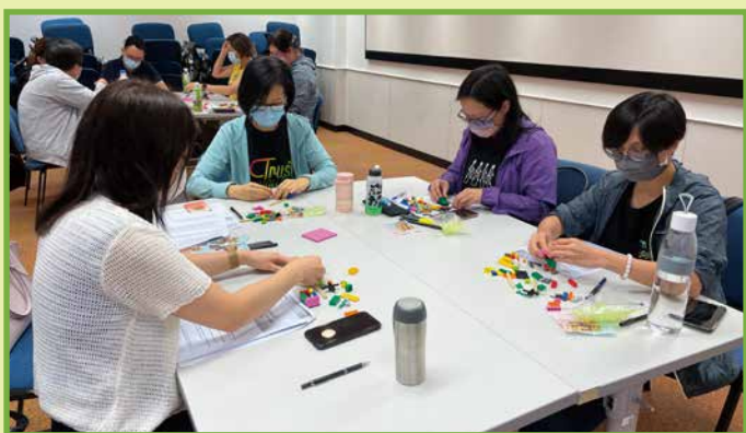
學員發揮創意，建構屬於自己的LEGO®模型

本年度的課程除課堂授課外，亦加入創新元素，以提升學員的想像力和創造力，並鼓勵他們以正面態度迎接轉變和挑戰。舉例說，課程加入「樂高認真玩」(LEGO® SERIOUS PLAY®) 環節，鼓勵學員跳出框框，從不同方面思考有關人力資源管理的問題，並以創新方式表達複雜概念，加強團隊互動和溝通。另外，課程亦讓學員透過虛擬實境 (Virtual Reality) 體驗，了解如何運用科技為員工提供培訓，並刺激他們的思維，引發他們從多角度思考。