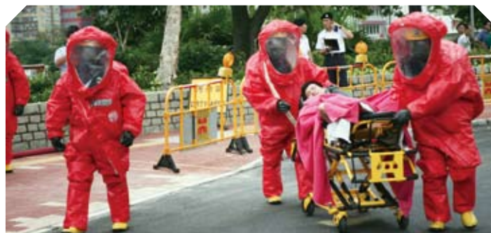
消防處正進行化生輻核襲擊事件演習。

在奧馬舉行期間保障公眾安全是消防處的重要使命。為此，處方正忙於制定應變計劃，以應付在比賽和非比賽場地發生的火警或緊急事故。