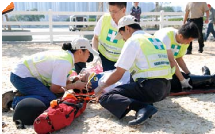
醫療輔助隊訓練義工提供醫療及急救服務。

醫療輔助隊會在比賽地點的熱身及訓練場地，為運動員和工作人員提供醫療及急救服務，並在奧運及殘奧大家庭酒店提供救護車服務。為進行籌備工作，醫療輔助隊早在二零零六年六月已成立統籌委員會，監察人手的調配。該隊調動了七名職員，七十六名醫生、一百九十名護士和二百零四名災難醫療助理，為奧馬提供支援。