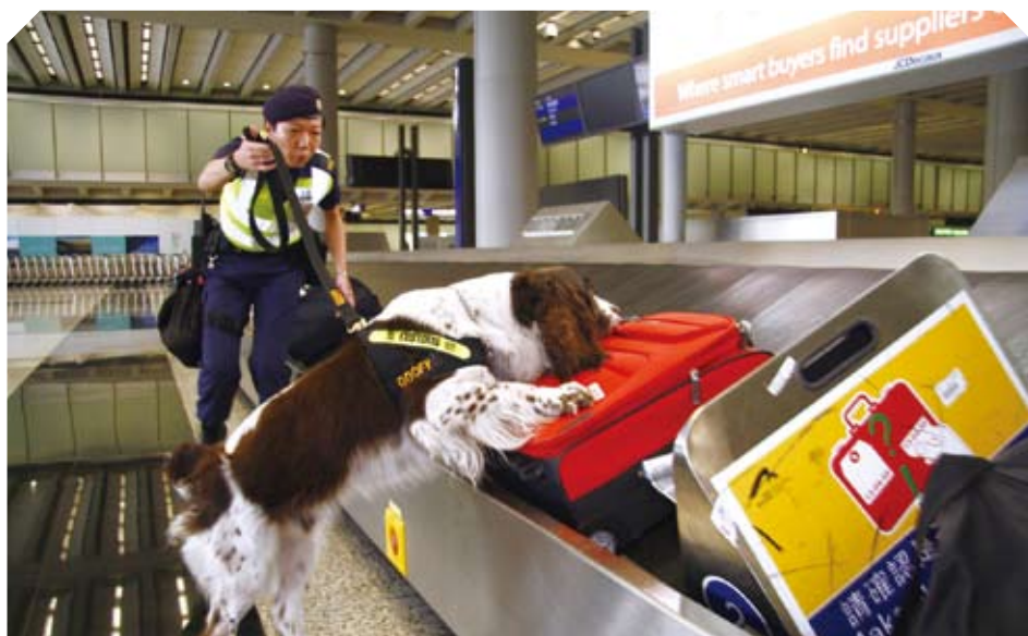
海關緝毒犬在機場協助關員偵測旅客的行李是否藏有毒品。

海關也在機場及各口岸加強抽查旅客和貨物；在旅客和貨物清關時，利用爆炸品搜查犬及先進儀器偵緝爆炸品。此外，又舉行簡報會和部門應變演習，讓前線人員充分掌握在遇到恐怖襲擊時如何應變。