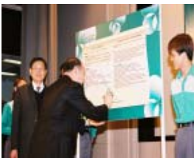
香港郵政安全管理系統及持續進步安全管理確認計劃第二級認證

部門安全及健康計劃清楚訂明了我們的職安健目標，並承諾為香港郵政轄下場所內的所有人士提供和維持安全健康的環境。計劃不但臚列了實施安全管理系統所需要的監控措施、程序、設備、資源和技能，同時亦界定了職安健事宜的權責，以及全面貫徹十四項安全管理元素的程序。