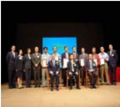
香港郵政獲頒「持續進步安全管理確認計劃」第二級認證

為貫徹“傳心意·遞商機”的郵政宣言，香港郵政需要一支盡心盡力，實力雄厚的工作隊伍，去為顧客提供世界級的服務。因此，香港郵政於一九九七年開始發展安全管理系統，希望藉此防止和杜絕工作間的意外和受傷事故。