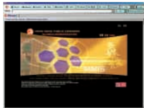
多媒體資訊 系統網頁

這點可見諸聯合國教育科學及文化組織把多媒體資訊系統納入其檔案入門網站( http://www.unesco.org/webworld/portal_archives/ )的決定。這個全球網站為研究各國歷史文化的檔案人員和研究者提供一站式資訊。