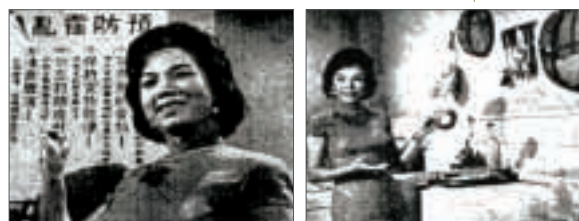
當年政府呼籲市民以沸水消毒食具的宣傳資料