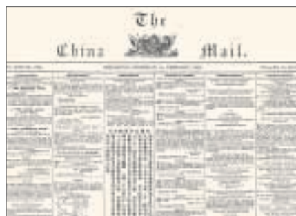
多媒體資訊系統顯示一八六六年二月一日出版的The China Mail(局部)