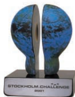
享譽全球 的斯德哥爾摩 科技挑戰獎

斯德哥爾摩科技挑戰獎由瑞典斯德哥爾摩市舉辦，旨在消除全球數碼隔膜。斯德哥爾摩市市長 Carl Cederschiold 先生表示，科技挑戰獎在十年內將會成為資訊社會發展領域的「諾貝爾獎」。