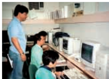
視障人士正學習使用「公共服務電子化」計劃提供的服務

「公共服務電子化」計劃網站的設計，是根據市民日常生活的需要來分門別類，突破傳統按政府部門劃分的方式，務求提供更周到的服務。市民和商界更可透過計劃享用下列服務：