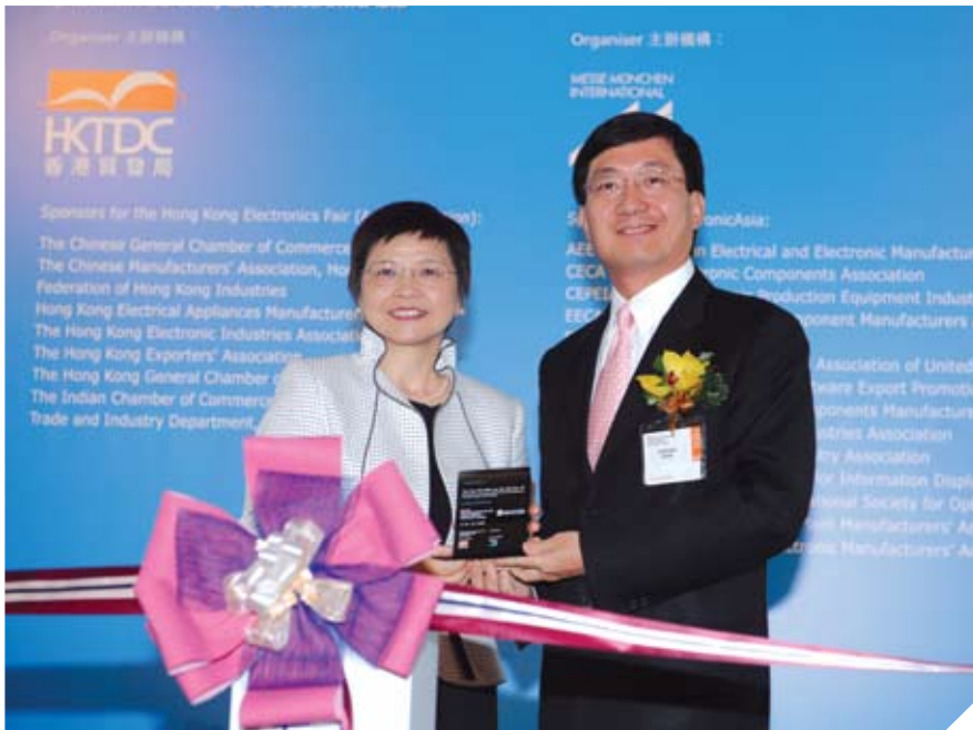
劉吳惠蘭為香港秋季電子產品展2008及國際電子組件及生產技術展2008主持開幕儀式。

「香港從來不懼怕競爭，我們有多方的強項、專才，加上政府和業界的支持，香港定能維持在會展旅遊業的領先地位。」她說。